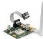
XAG 8000 Módulo GPRS